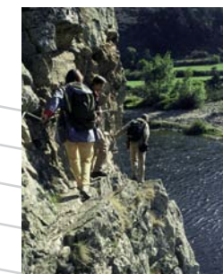
Randonnée en Haute vallée de la Loire

la Directive Habitats (Natura 2000) de l'Union Européenne, qui recense, rien que sur le Haut Allier, 51 espèces et 21 habitats naturels, dont 4 prioritaires !