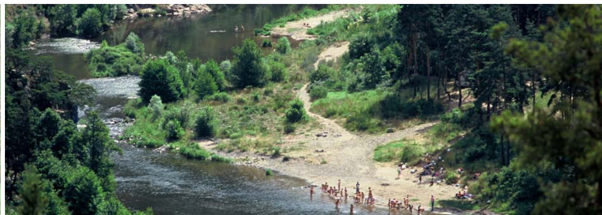
Baignade à Serre de la Fare, dans la Haute Vallée de la Loire