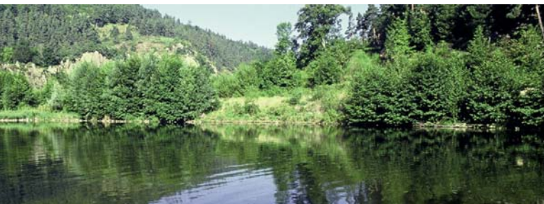
La Haute vallée de la Loire vers Goudet

des grands barrages prévus sur la Loire, « dernier fleuve sauvage d'Europe ». Dans le cadre de son programme « Rivières Vivantes », Il appuie aujourd'hui la mise en place du « Plan Loire Grandeur Nature », premier plan de gestion durable d'un fleuve en France. Avec SOS Loire Vivante, il est à l'origine du projet de création d'une « Réserve de Biosphère » sur les sources de la Loire et de l'Allier. Il travaille en étroite synergie avec les ONG locales, les institutions départementales, régionales et les divers acteurs économiques.