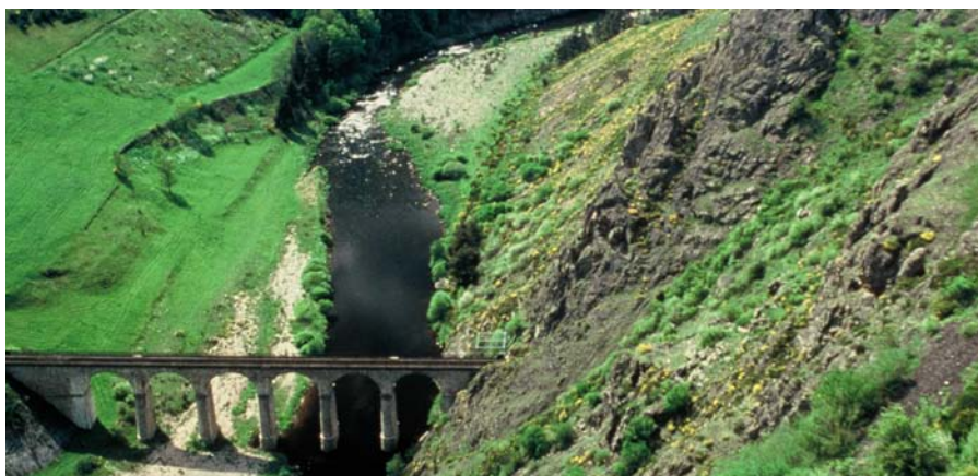
Viaduc sur le Haut Allier sur la ligne du "Cevennol"