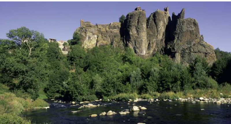
Site d'Arlempdes, haute vallée de la Loire

de valorisation de son "capital rivières", en tous points exceptionnel. Cette désignation apporterait la reconnaissance du caractère pilote de beaucoup d'actions innovantes entreprises sur ce territoire. Elle aiderait à affirmer les actions de développement local lancées depuis quelques années ou en projet.