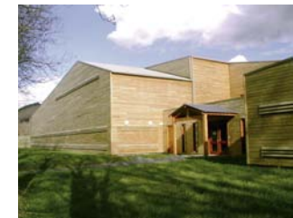
Salmoniculture de Chanteuges sur le Haut-Allier

Un des grands intérêts du territoire des sources de la Loire et de l'Allier est son histoire récente forte. Après avoir divisé les hommes, il les rassemble aujourd'hui. Entre 1986 et 1994, associations de protection de la nature et aménageurs se sont affrontés autour de la question de l'aménagement des Hautes Vallées. Ce conflit, par delà les incompréhensions réciproques, a permis de prendre conscience de leur extraordinaire capital naturel. Aujourd'hui, avec l'adoption du "Plan Loire Grandeur Nature" (4-1-1994), les conséquences positives en sont très nombreuses. Pour sauver le Saumon atlantique, le SMAT 1 a construit la plus grande salmoniculture d'Europe à Chanteuges, sur le Haut Allier, devenu Conservatoire National du Saumon Sauvage en 2007. L'Etat a fait effacer le barrage de St Etienne du Vigan , pour faciliter les migrations et n'a pas renouvelé la concession du grand barrage de Poutès-Monistrol. L'aménagement de la Loire à Brives-Charensac, pour gérer le risque naturel de crues en élargissant le lit majeur du fleuve, est aussi exemplaire. Récemment, le Conseil Général de Haute-Loire a lancé un SAGE 2 sur la "Loire amont", permettant d'aborder le problème du transfert des eaux de la Loire dans l'Ardèche , via le barrage EDF de Lapalisse/Montpezat.