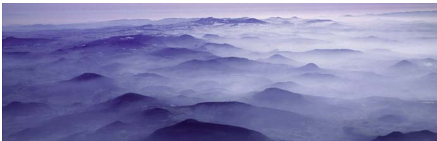
Les sucs de l'Yssingelais, autour du Meygal, dans la brume