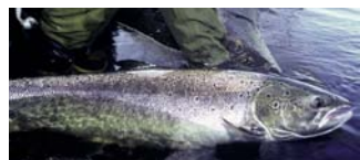
Saumon atlantique (Salmo salar)

Un des grands intérêts du territoire des sources de la Loire et de l'Allier est son histoire récente forte. Après avoir divisé les hommes, il les rassemble aujourd'hui. Entre 1986 et 1994, associations de protection de la nature et aménageurs se sont affrontés autour de la question de l'aménagement des Hautes Vallées. Ce conflit, par delà les incompréhensions réciproques, a permis de prendre conscience de leur extraordinaire capital naturel. Aujourd'hui, avec l'adoption du "Plan Loire Grandeur Nature" (4-1-1994), les conséquences positives en sont très nombreuses. Pour sauver le Saumon atlantique, le SMAT 1 a construit la plus grande salmoniculture d'Europe à Chanteuges, sur le Haut Allier, devenu Conservatoire National du Saumon Sauvage en 2007. L'Etat a fait effacer le barrage de St Etienne du Vigan , pour faciliter les migrations et n'a pas renouvelé la concession du grand barrage de Poutès-Monistrol. L'aménagement de la Loire à Brives-Charensac, pour gérer le risque naturel de crues en élargissant le lit majeur du fleuve, est aussi exemplaire. Récemment, le Conseil Général de Haute-Loire a lancé un SAGE 2 sur la "Loire amont", permettant d'aborder le problème du transfert des eaux de la Loire dans l'Ardèche , via le barrage EDF de Lapalisse/Montpezat.