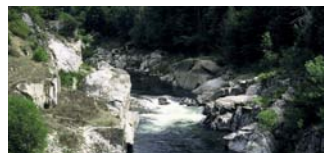
Barrage enlevé (St Etienne du Vigan), sur le Haut-Allier