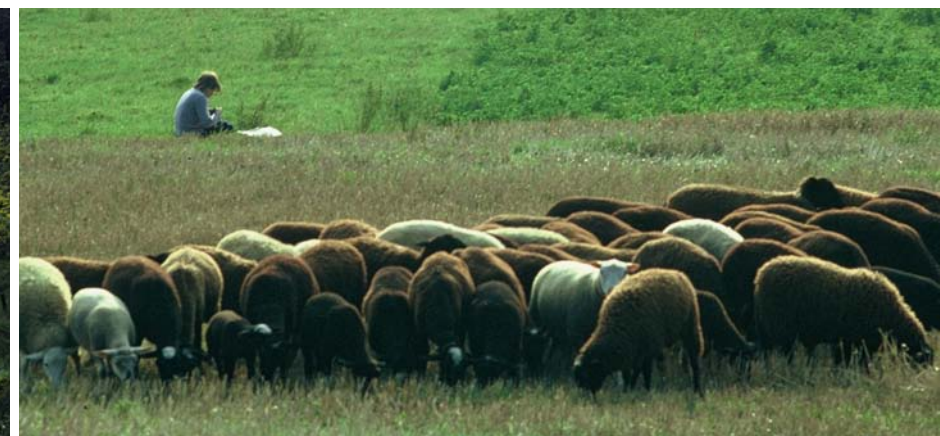
La "noire du Velay" au pâturage