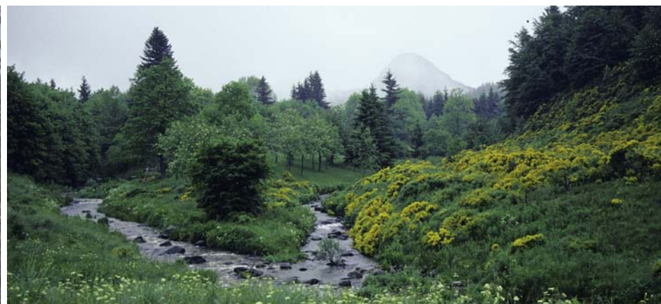
Source de la Loire, Gerbier de Jonc