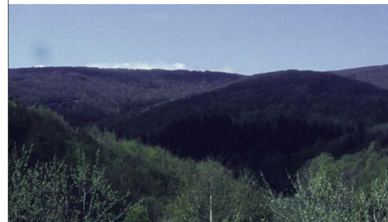
Sources de l'Allier, Moure de la Gardille