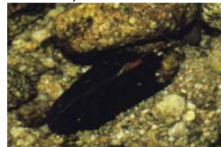
La Moule perlière

"Directive Oiseaux". L'ensemble des hauts bassins de la Loire et de l'Allier se retrouve au niveau des meilleurs sites européens pour le nombre d'espèces patrimoniales. La Loutre , mais aussi le Circaète et le Sonneur à ventre jaune présentent des densités