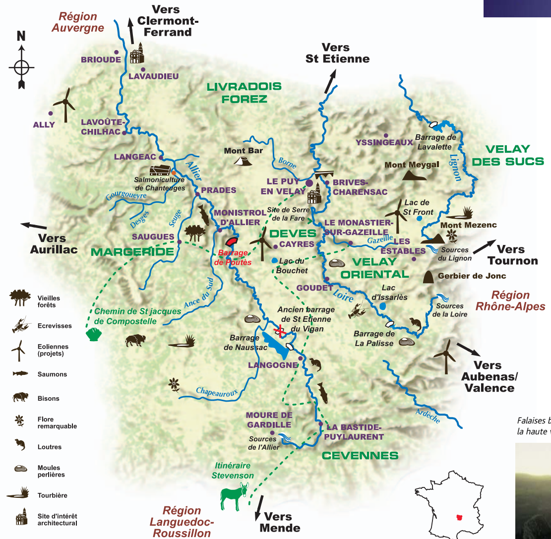
Falaises basaltiques dans la haute vallée de la Loire