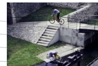
Les berges de la Loire à Brives-Charensac rendues aux riverains avec le plan Loire Grandeur Nature