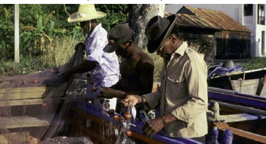
Réserve de Biosphère : de Guadeloupe...