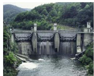
Barrage de Poutès-Monistrol

mesures de préservation de l'environnement sont appliquées (arrêté de biotope, réserve naturelle...). Ce noyau est entouré d'une zone tampon . Sur l'ensemble du territoire de la réserve de biosphère, une politique globale de développement durable est définie pour donner cohérence et vision à long terme. Le programme est mis en place et animé par une équipe légère, en lien étroit avec les collectivités, la population, les acteurs économiques et associatifs et soutenu par un conseil scientifique.