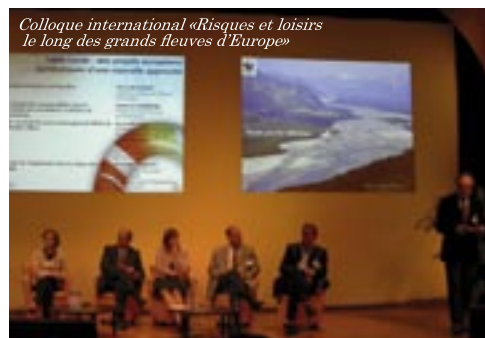
Colloque international «Risques et loisirs le long des grands fleuves d'Europe»

à Orléans : organisation par l'Etablissement du colloque international « risques et loisirs le long des grands fleuves d'Europe » dans le cadre du projet européen Freude am Fluss et du festival de Loire.