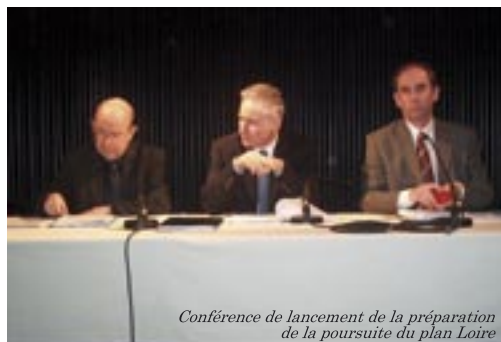
Conférence de lancement de la préparation de la poursuite du plan Loire

Le 24 novembre : Décision de principe de l'Etablissement de rétrocéder au Département de la Creuse, pour l'Euro symbolique, le patrimoine foncier bâti et non bâti acquis dans le cadre du projet de Chambonchard, situé sur ce Département.