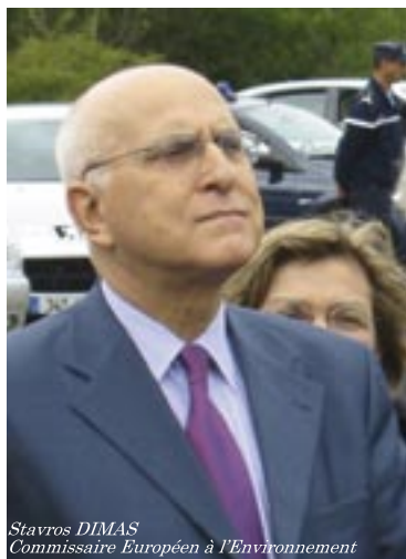
Stavros DIMAS Commissaire Européen à l'Environnement

Le 14 février : Déplacement à Orléans de Serge LEPELTIER, Ministre de l'Écologie et du Développement Durable qui a assisté à une réunion de la commission Loire du Comité de Bassin Loire-Bretagne. Signature, en présence du Ministre, de la charte Classes Loire entre l'Etat, l'agence de l'eau Loire-Bretagne et l'Etablissement.