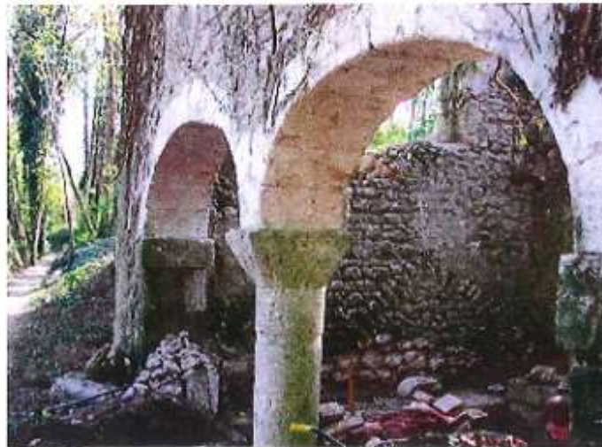
Lavoir du château de Montlivault (41) envahi à la végétation et à l'oubli par son propriétaire

1 ère phase : L'inventaire du patrimoine culturel inondable