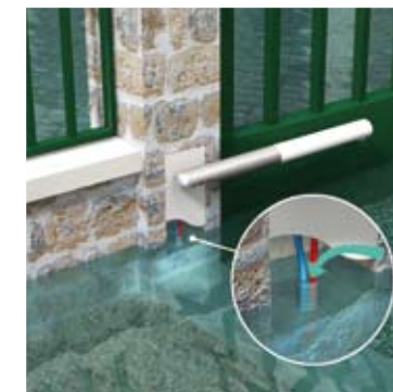
Passage possible de l'eau par les entrées de gaine.

La limitation de la pénétration de l'eau dans le logement par les défauts de construction passe par l'application simultanée, dans la hauteur des parties susceptibles d'être immergées, des mesures suivantes :