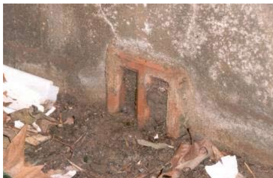
Endommagement après pénétration d'eau à travers une entrée d'air.

Cette mesure a pour objet de limiter la pénétration d'eau ce qui permet de réduire les dommages et le délai de retour à la normale.