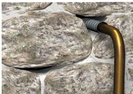
Situation initiale : passages possibles de l'eau à travers le mur.