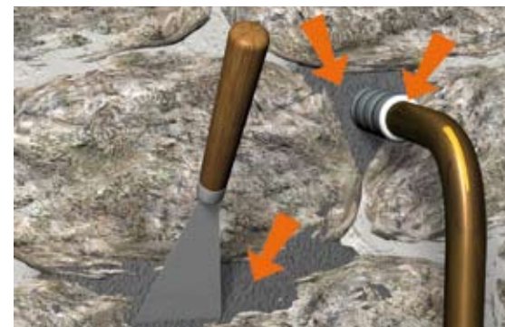
Situation après travaux : colmatage des voies d'eau.