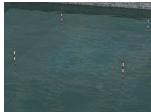
Les piquets délimitent l'emprise au sol de la piscine lorsque le niveau de l'eau dépasse la barrière