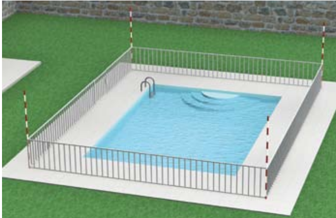
Piscine privative équipée d'une barrière de sécurité

Entretien des barrières conformément aux instructions du fabricant.