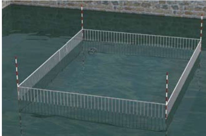
La barrière de sécurité reste visible tant que le niveau de l'eau est inférieur à sa hauteur