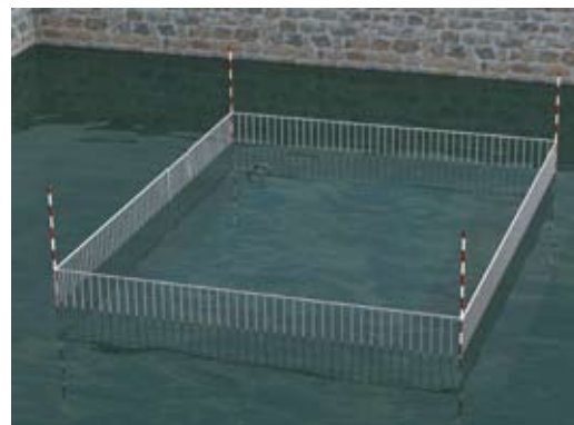
La barrière de sécurité reste visible tant que le niveau de l'eau est inférieur à sa hauteur