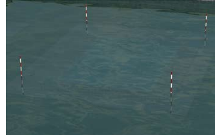
Les piquets délimitent l'emprise au sol de la piscine lorsque le niveau de l'eau dépasse la barrière