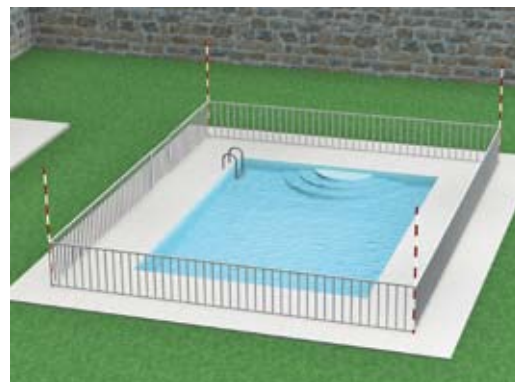
Piscine privée équipée d'une barrière de sécurité

Ces repères seront conçus pour être bien visibles et alerter les intéressés du danger potentiel.