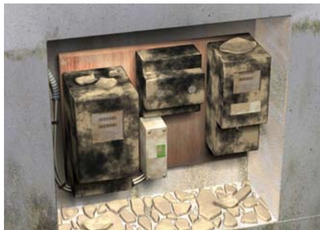
Dégradation d'un coffret de branchement extérieur. Crédit photo

Après l'inondation, tout matériel électrique sous tension (câble électrique, tableaux électriques, luminaire, prise de courant, interrupteur, mais aussi moteur électrique des portes de garage et des volets roulants, chauffe-eau électrique, convecteur, climatiseur) peut être la source d'accidents graves voire d'électrocution mortelle dans la mesure où les dispositifs de protection contre les surintensités des circuits (disjoncteurs et fusibles) et de sécurité des personnes contre les chocs électriques (dispositifs différentiels) sont endommagés.