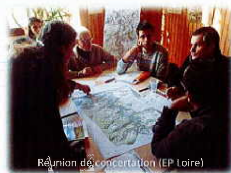
Réunion de concertation (EP Loire)

Sur le site de la « Haute vallée de Loire », le projet de règlement a été établi en conformité avec le Code de l'Environnement et en concertation avec les acteurs locaux . C'est pourquoi, en complément des réunions entre partenaires, une série d'ateliers participatifs a été organisée fin 2013 par l'Etablissement public Loire.