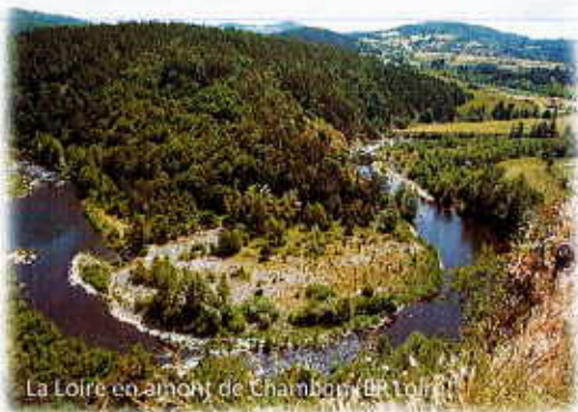
La Loire en amont de Chambourg-sur-Loire