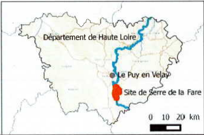
PLAN IGN® © IGN, EP Loire. Auteur : EP Loire, mai 2015