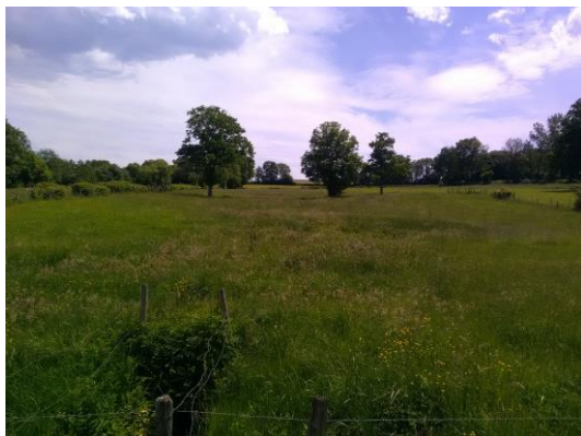
Zone humide à Saint Bonnet

Ainsi, l' inventaire des zones humides sur le bassin de la Sioule , a débuté en avril avec l'arrivée de l'agent recruté spécifiquement pour assurer en régie cette mission. Après des premières réunions organisées avec les élus et autres acteurs des 18 communes concernées en 2019, la phase de prospection de terrain a débuté mi-juin.