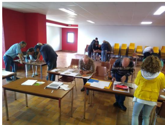
Réunion de travail - Commune de Gelles

Dans le cadre de l' étude « Hydrologie, Milieux, Usages et Climat » menée sur le bassin de l' Allier , la phase d'installation de 60 nouvelles stations de suivi hydrologique est en cours. A partir de septembre, un travail de recueil de données relatives aux usages de la ressource sera entrepris à l'aide d'un questionnaire adressé à l'ensemble des acteurs pouvant disposer d'informations (syndicats des eaux, chambres d'agriculture, DDT, ...). Après une phase d'analyse de ces données des réunions de concertation seront organisées début 2020.